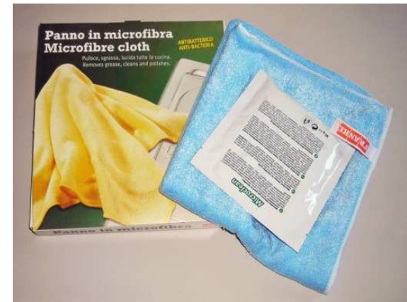
Panno in microfibra